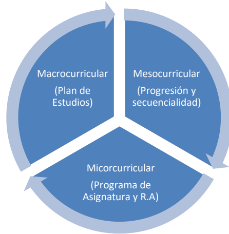
Fig. Diseño Curricular Integrado de Postgrado

Como se mencionó, el trabajo a nivel micro-curricular viene a cerrar un círculo virtuoso de innovación curricular que se inició en el 2015. Aunque el avance de estandarización en base a este formato para la modalidad presencial está cercano al 30%, es importante mencionar que este proceso de estandarización micro-curricular se ha acelerado debido al trabajo previo de planificación de la enseñanza/aprendizaje que se requiere para sustentar la calidad formativa para los Entornos Virtuales de Aprendizaje (EVA) de los Programas de Postgrado que desean virtualizarse, tanto en la modalidad mixta o b-learning o totalmente virtual así como por la iniciativa de Facultades y departamentos, como lo mencionamos anteriormente.